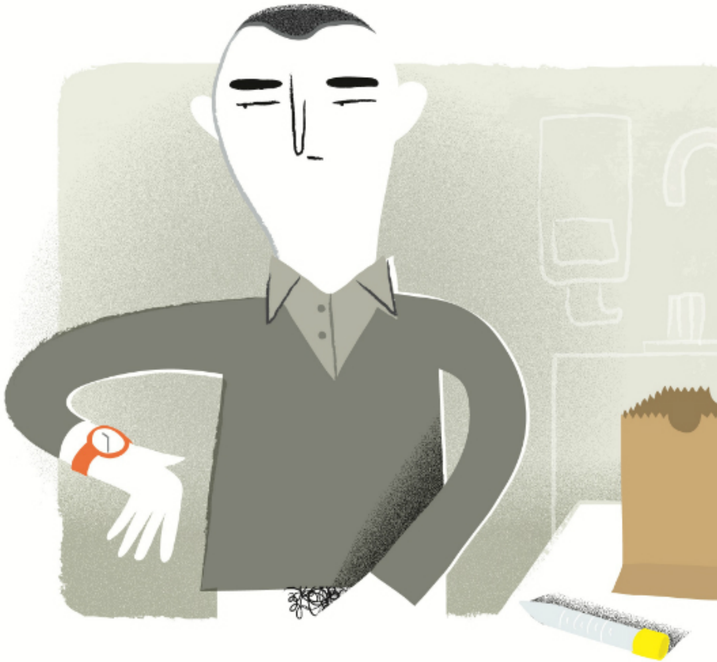
Illustration © Marie Mainguy

Écrit par Jean-Benoit Nadeau Samedi, 04 Octobre 2014 14:43 -