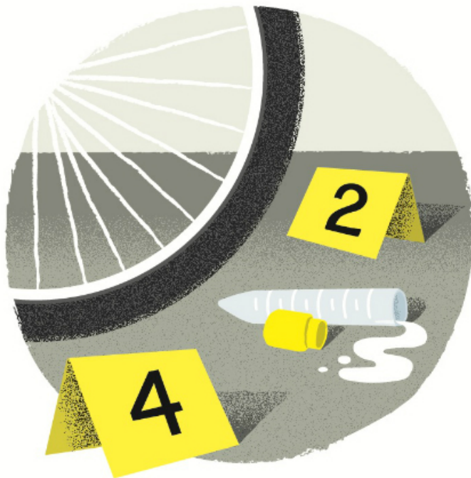
Illustration © Marie Mainguy

On peut s'efforcer de rêver, y aller de la main gauche pour se faire croire que c'est quelqu'un d'autre, mais bon, madame la réceptionniste est à trois mètres, et elle écoute, j'en suis sûr, la cochonne. À moins qu'il y ait des micros et des caméras cachés — je m'imagine à Surprise sur prise , à me remonter le pendule tandis que Béliveau est de l'autre côté de la porte qui m'attend avec ma femme, ma mère, mon père, mon frère et tous mes amis — « Surprise sur prise ! »