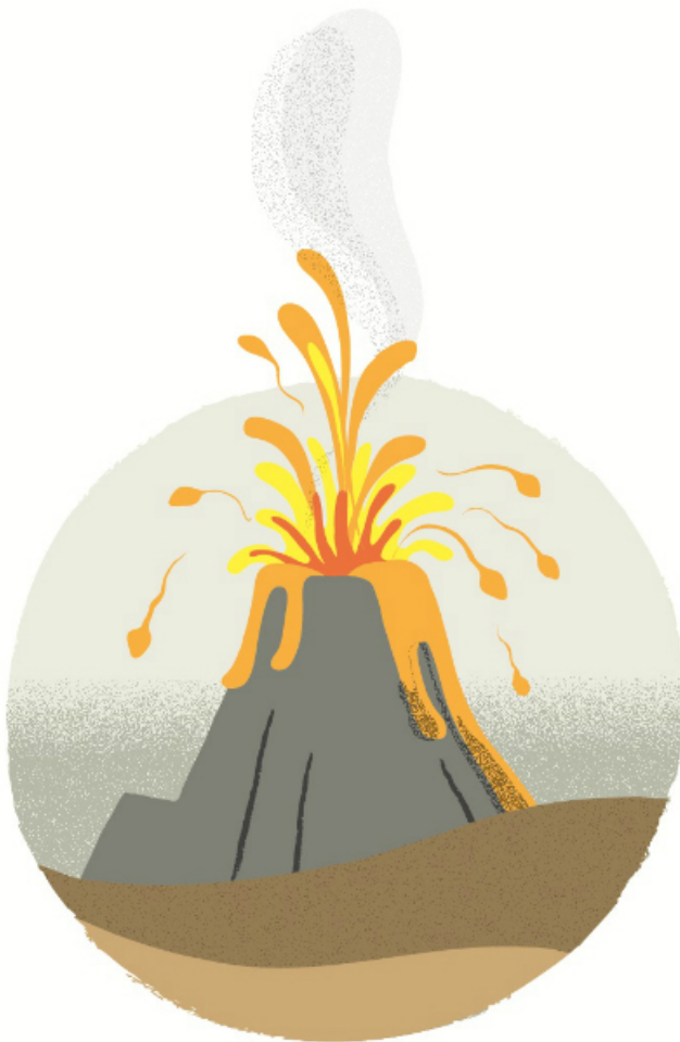
Illustration © Marie Mainguy

Je suis donc sorti Gros-Jean comme devant avec mon sac de papier brun dans la rue Clare. Il y avait, pas loin, un parc. J'aurais pu aller me masturber dans le buisson et revenir à la course. Mais c'est des trucs à la con, si un passant prévient la police : « C'était pour un prélèvement, Votre Honneur. » Bon, j'aurais pu aussi aller me masturber dans une toilette du Tim Hortons d'en face, mais c'est encore un autre truc à la con. Autant se remonter le pendule chez soi tranquillos.