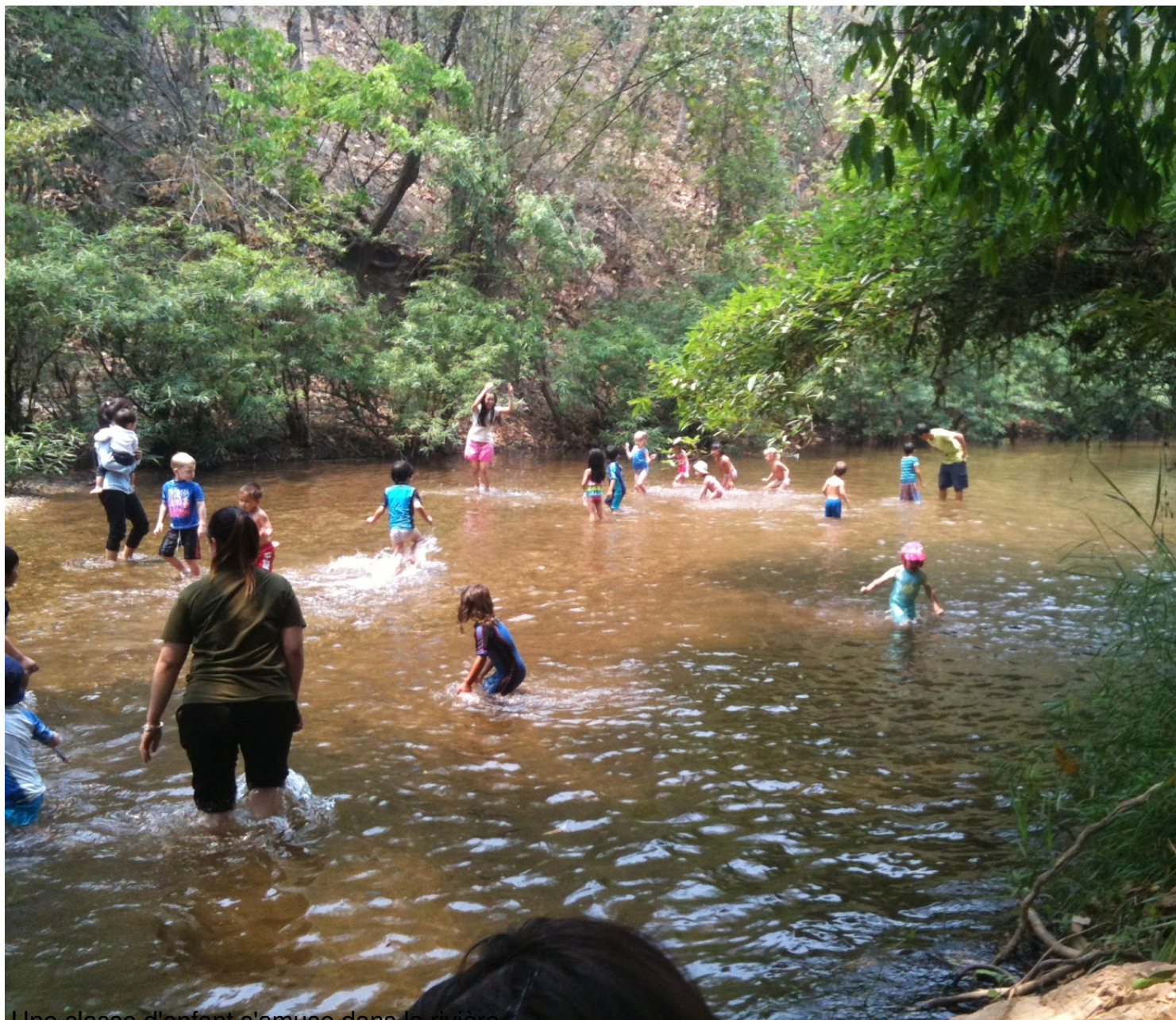
Une classe d'enfant s'amuse dans la rivière