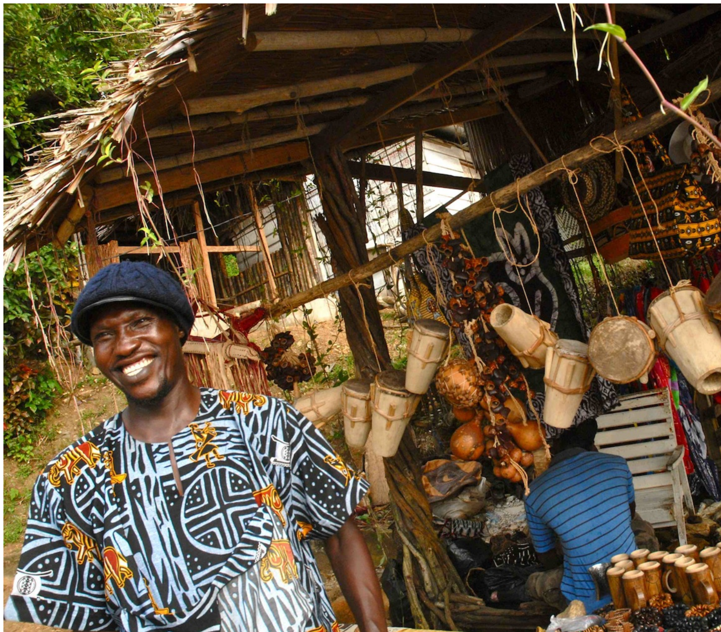
Vendeur d'artisanat, chutes de la Lobé

Au printemps dernier, j'ai séjourné une dizaine de jours au Cameroun. Alors que s'approche la meilleure période de l'année pour se rendre dans ce pays d'Afrique centrale, voici dix bonnes raisons pour passer à l'action.