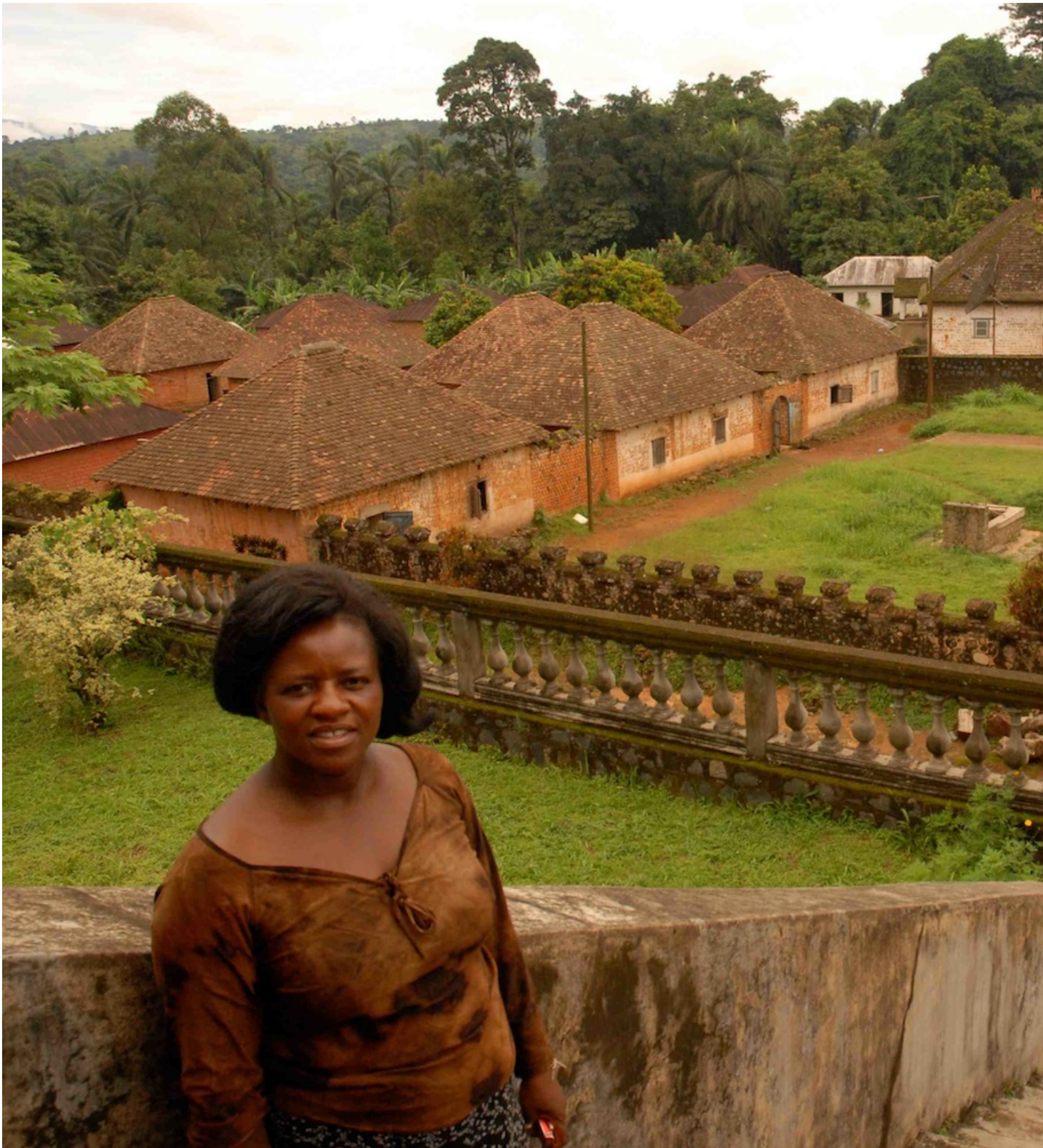
La chefferie et l'une des « reines » de Bafut – Gary Lawrence