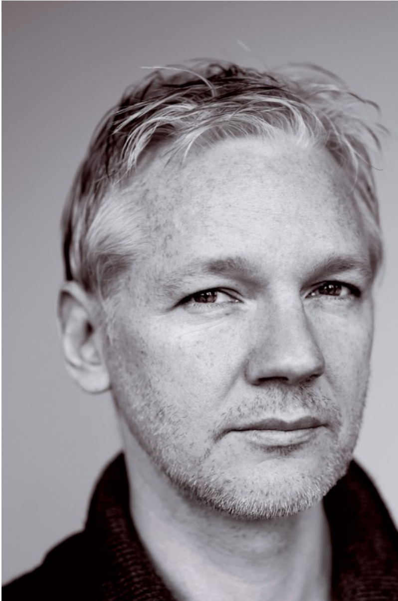
Julian Assange