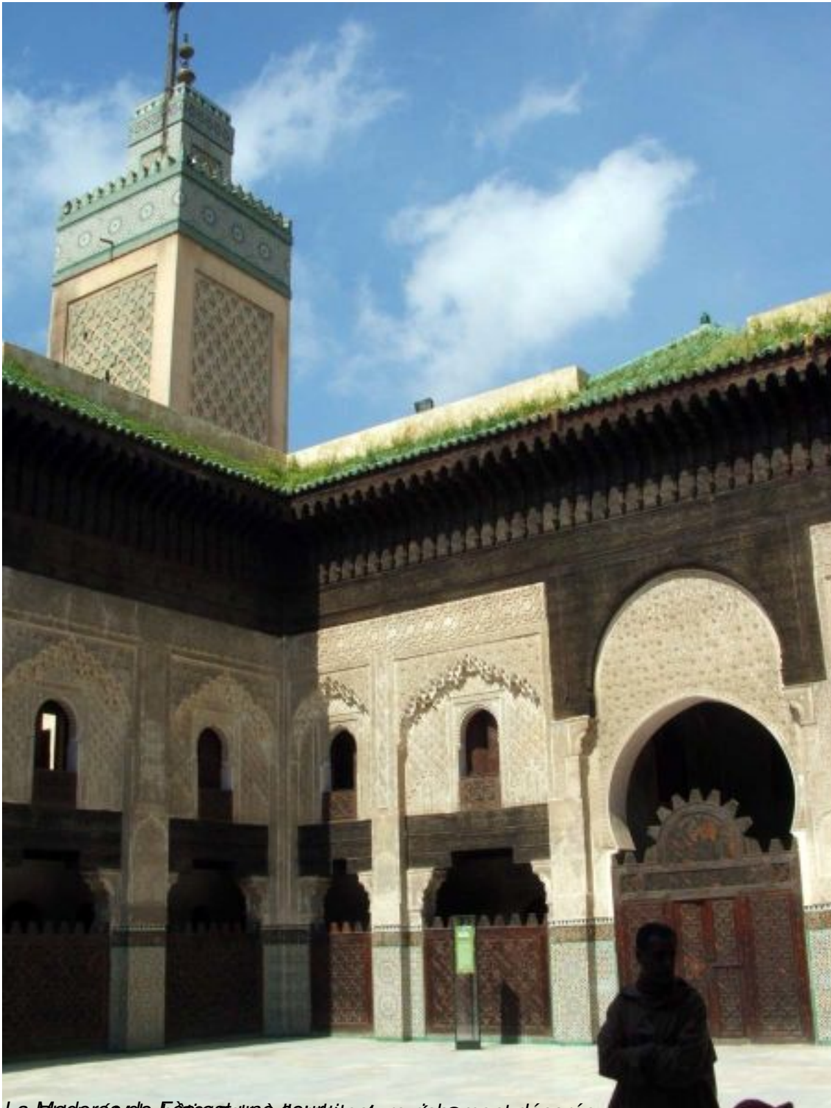
La Medersa de Fès est une œuvre remarquablement décorée et est considérée comme l'une des plus belles réalisations de l'architecture islamique. Elle est caractérisée par ses motifs géométriques et ses motifs symboliques.