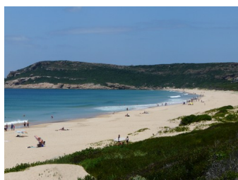
plage de Plettenberg Bay