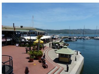
Knysna, Afrique du Sud