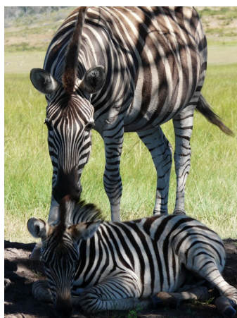
Plettenberg Bay réserve, safari