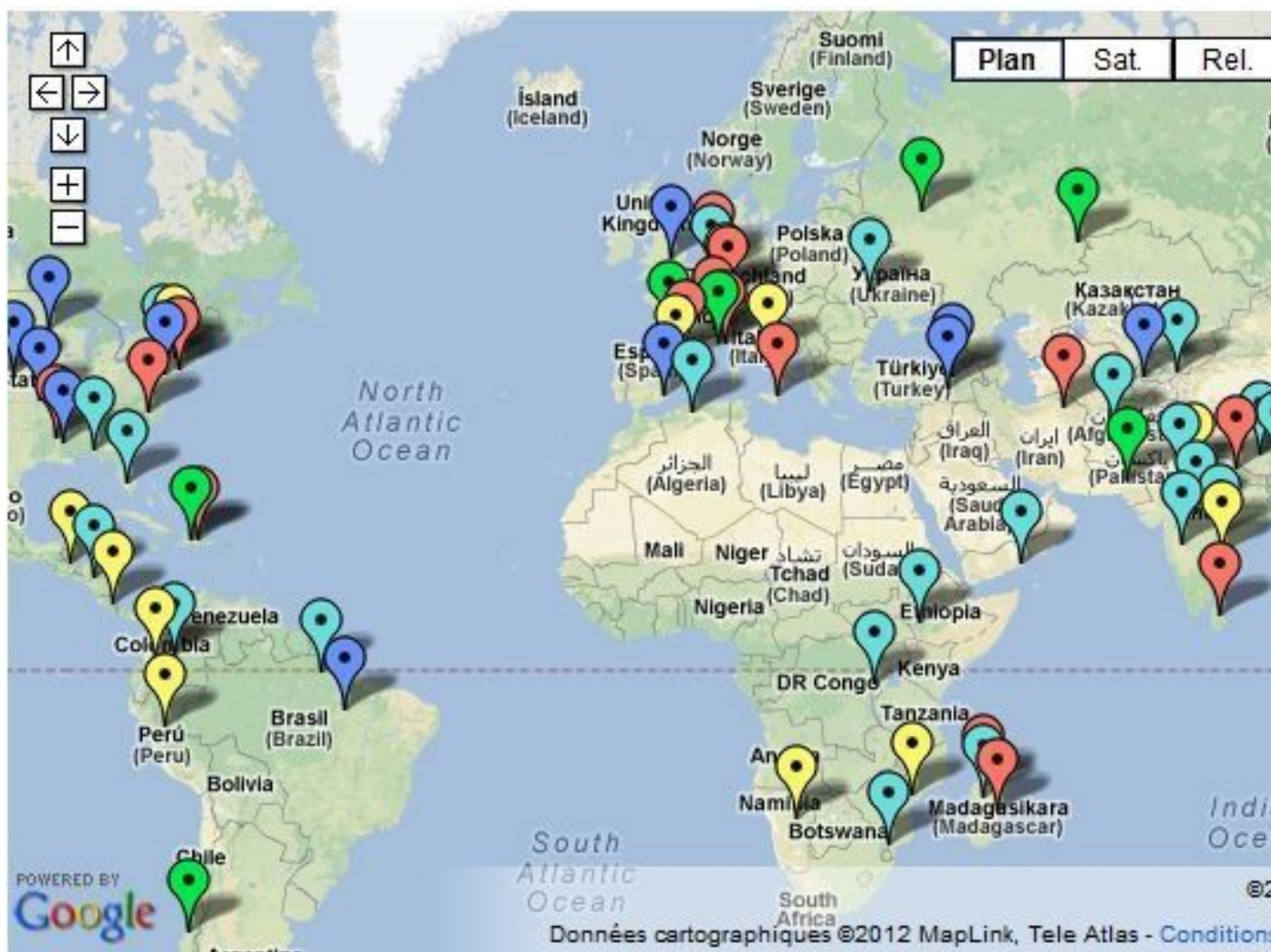
Carte des catastrophes naturelles à travers le monde depuis 2008