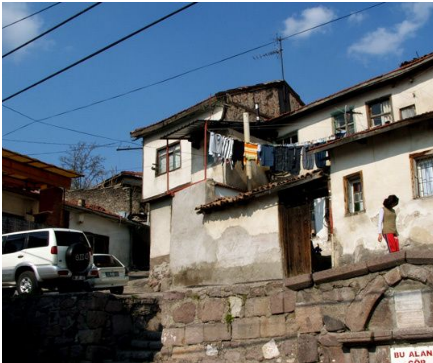
Ruelle et maisons typiques de la citadelle d'Ankara - Turquie (2008)