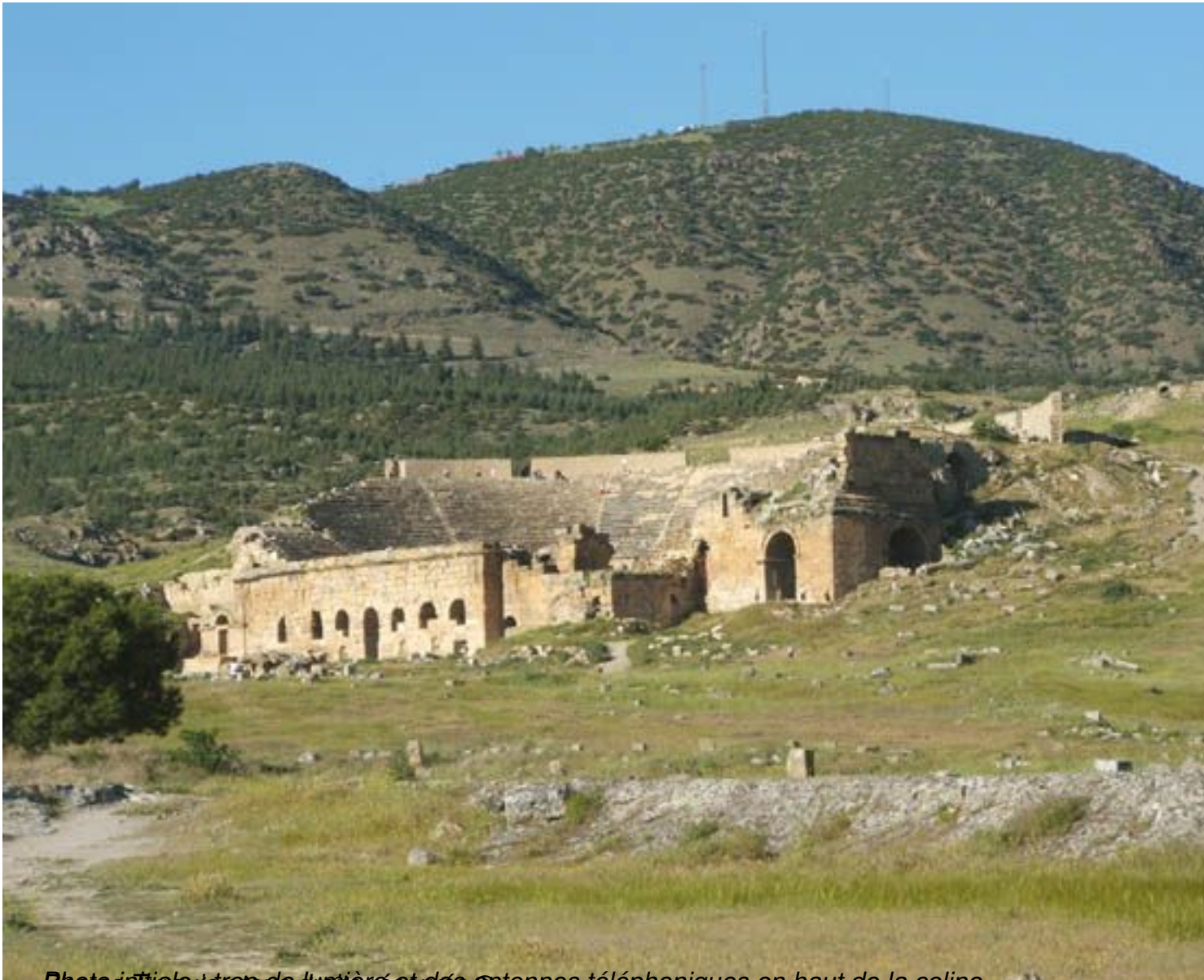
Photo initiale trop de lumière et des antennes téléphoniques en haut de la coline sur laquelle se trouve les ruines. (avec un filtre 1/8000) Je reconnais le source automatique n'est pas très efficace,