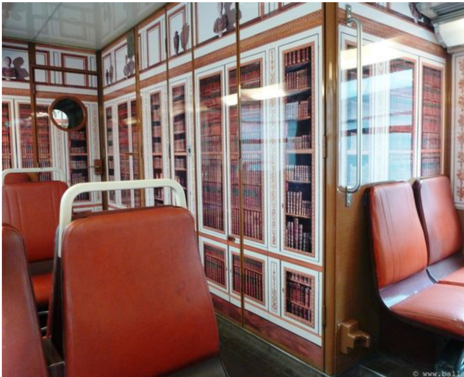
Version bibliothèque du Roi...