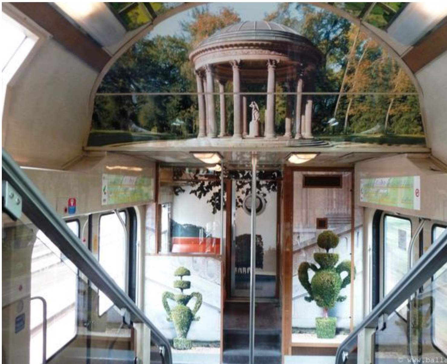
Ambiance Petit Trianon